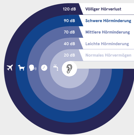
Hörminderung, gemessen in Dezibel: Je leiser die Geräusche, desto weniger nehmen die Betroffenen wahr.

Partielle Hörminderung tritt im Hochtonbereich auf; dabei sind im Gegensatz zur Schallempfindungsschwerhörigkeit lediglich die Haarsinneszellen an der Basis der Cochlea beschädigt, nicht aber jene im innersten Bereich, die für das Hören tiefer Töne zuständig sind.